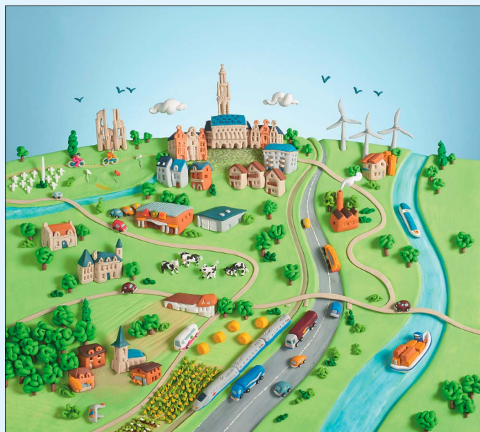
© Agence Tourmant Arras - Illustration : Frédéric Moreau

Le meilleur est à venir, partageons notre avenir ! L'évolution de notre territoire dans les prochaines années doit permettre d'offrir aux habitants toutes les conditions pour bien y vivre. Construction de logements de qualité, implantation de zones économiques et commerciales créatrices d'emplois, réalisation d'équipements nécessaires au quotidien, organisation de votre mobilité, préservation des espaces agricoles et naturels... Venez découvrir comment pourra être votre territoire dans 20 ans. Cette vision du futur est celle du Projet d'Aménagement et de Développement Durables (PADD) du Schéma de Cohérence Territoriale de l'Arageois porté par le SCoTA. Le PADD est un document d'urbanisme, qui indique la direction que les élus prendront pour faire évoluer le territoire au profit de la population. Sont concernés près de 170 000 habitants des 206 communes couvertes par le SCoTA, qui associe la Communauté Urbaine d'Arras, les Commu-