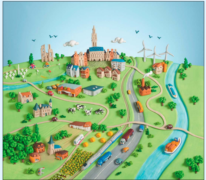
© Agence Tourmant Arras - Illustration : Frédéric Moreau

Le meilleur est à venir, partageons notre avenir ! L'évolution de notre territoire dans les prochaines années doit permettre d'offrir aux habitants toutes les conditions pour bien y vivre. Construction de logements de qualité, implantation de zones économiques et commerciales créatrices d'emplois, réalisation d'équipements nécessaires au quotidien, organisation de votre mobilité, préservation des espaces agricoles et naturels... Venez découvrir comment pourra être votre territoire dans 20 ans. Cette vision du futur est celle du Projet d'Aménagement et de Développement Durables (PADD) du Schéma de Cohérence Territoriale de l'Arrageois porté par le SCoTA. Le PADD est un document d'urbanisme, qui indique la direction que les élus prendront pour faire évoluer le territoire au profit de la population. Sont concernés près de 170 000 habitants des 206 communes couvertes par le SCoTA, qui associe la Communauté Urbaine d'Arras, les Commu-