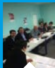
REUNION DE TRAVAIL DU 31 JANVIER 2017