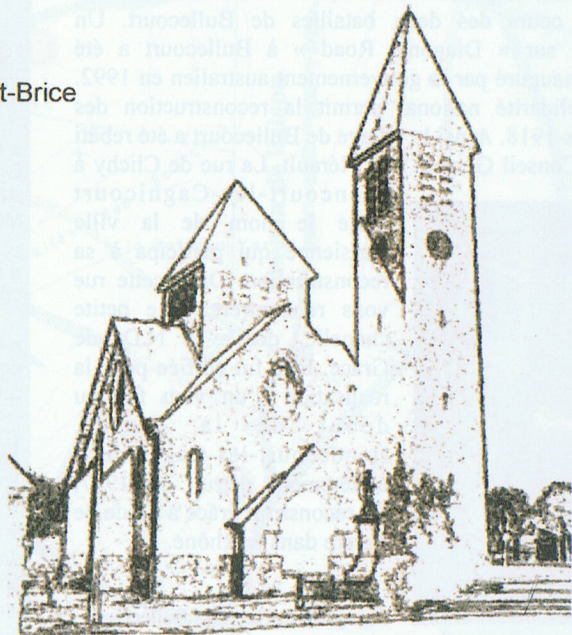
Eglise Saint-Brice de Noreuil